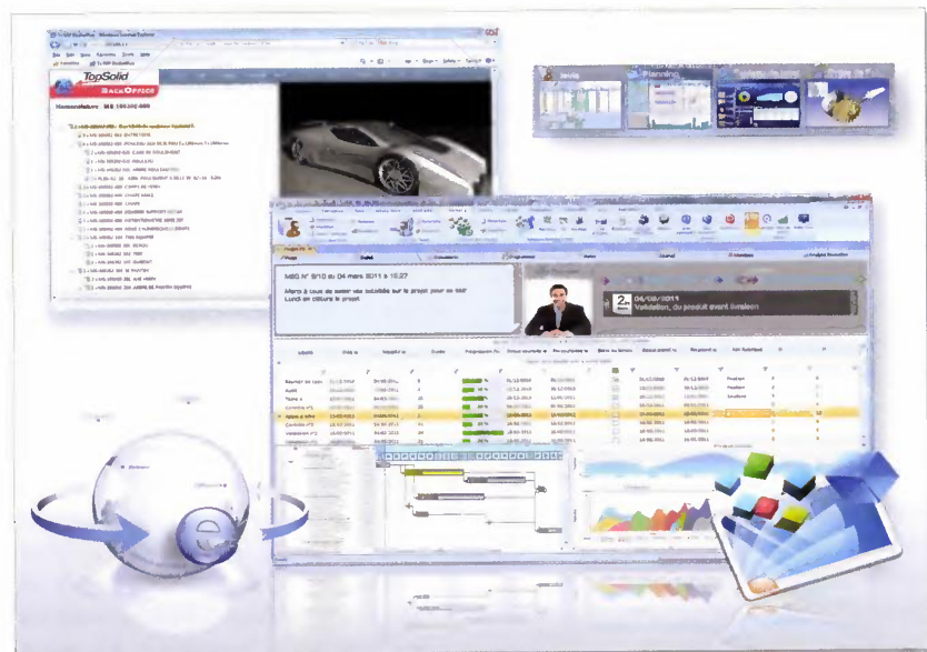
La nouvelle version de TopSolid/ERP offre une approche intégrée de la production depuis la conception jusqu’à la livraison du produit et l’analyse financière.

Quelques avantages de la solution : tout d’abord, il convient de signaler une architecture nouvelle, conçue pour faciliter le développement de logiciels verticaux, la maintenance et l’évolutivité. S’ajoute une interopérabilité complète avec la plateforme applicative Microsoft, basée sur SQL Server 2008 R2, Visual Studio 2010,