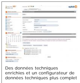
Des données techniques enrichies et un configurateur de données techniques plus complet