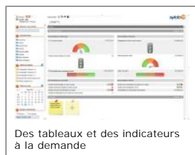
Des tableaux et des indicateurs à la demande